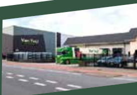
VTH Haften Hertog Karelweg 25