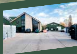
VTH Tuil Bouwing 2a