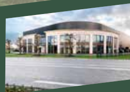
VTH Opheusden Pottenveld 2

www.vth.nl info@vth.nl +31(0)418-59 23 55