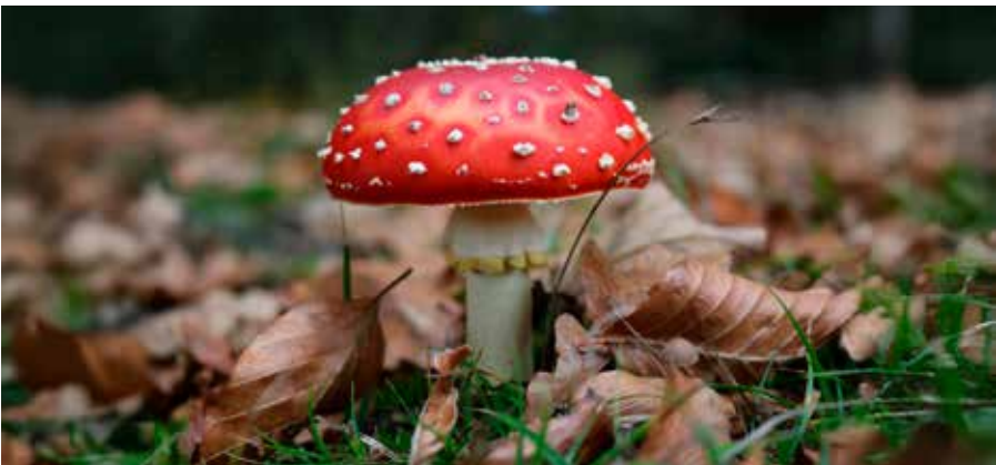
November, maand van de Paddenstoel.

De vergadering wordt gesloten na een moment van stilte voor gebed of bezinning.