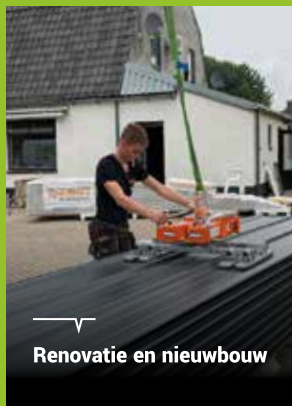
Renovatie en nieuwbouw